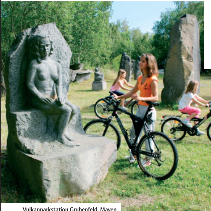
Vulkanparkstation Grubenfeld, Mayen